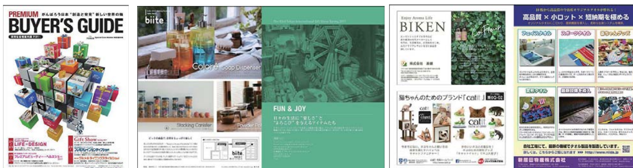
▲バイヤーズガイドブックイメージ